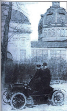
Érkezés autómobilon a Budapesti Nemzetközi Autómobil Kiállításra